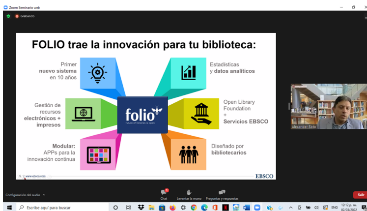
Taller sobre la Plataforma FOLIO (organizado por EBSCO)