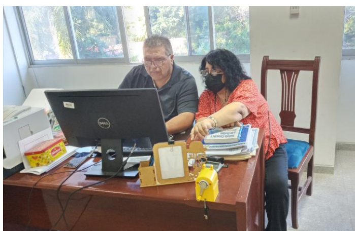
Verificación del proyecto de la biblioteca con el técnico de la Of. de Planificación de la UAGRM