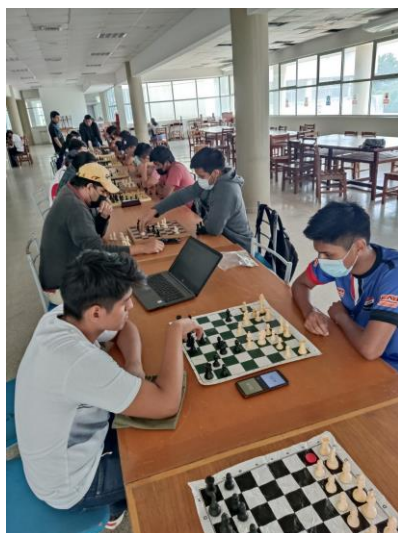
Jornadas de ajedrez julio del 2022